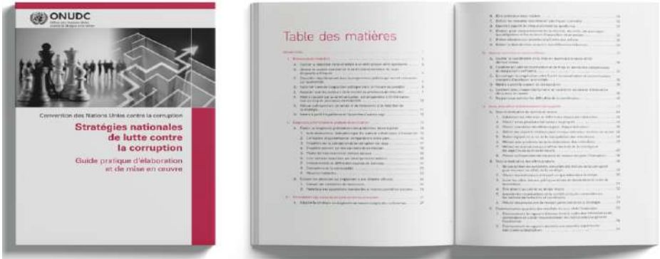
Une SNLCC élaborée suivant le processus préconisé par le guide de l’ONUDC

Se voulant respectueuse des bonnes pratiques internationales, la conception de la SNLCC a été réalisée conformément aux orientations du Guide pratique d’élaboration et de mise en œuvre de stratégies nationales de lutte contre la corruption de l’Office des Nations Unies contre la drogue et le crime (ONUDC) et des standards du Programme des Nations Unies pour le Développement (PNUD) en matière de gestions axée sur les résultats.